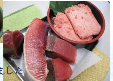
すしネタは近隣のすし屋から仕入れました