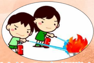
消火栓での初期消火

3月6日に3階、5階の寮母室から出火した想定で避難訓練を行いました。消火器の使用方法や心臓マッサージの訓練も合わせて行い、皆真剣に取り組んでいました。