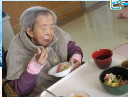
ビールも美味しく頂きました